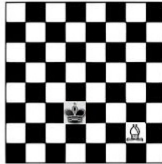
Hình ảnh quân vua ở vị trí (3,4) và quân tượng ở vị trí (2,7)